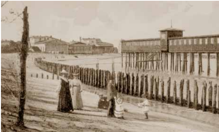
Rügenwaldermünde – das erste pommersche Seebad

Und so wurde das wohl älteste pommersche Seebad – das übrigens auch das älteste Seebad Preußens war – 1814 in Rügenwaldermünde begründet. Dem allgemeinen Trend folgend, entstanden später aus vielen kleinen Fischerdörfern die Seebäder, deren Namen uns bis heute vertraut sind. Ihre Anzahl scheint an der Pommerschen Küste unbegrenzt und sie ziehen sich gleich einer Perlenschnur von der vorpommerschen Halbinsel Darß bis nach Stolpmünde in Hinterpommern.