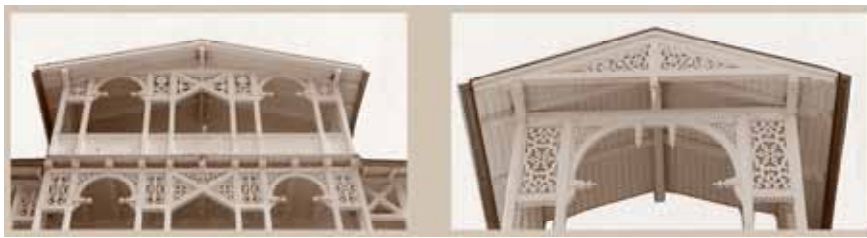
Preisgünstige Formenvielfalt: Die Laubsägearchitektur

Was also tun? Die neuen Hotels und Pensionen waren schließlich Zweckbauten. Sie folgten, bei aller heutigen Verklärung der Notwendigkeit eine Vielzahl von Gästen unterzubringen.